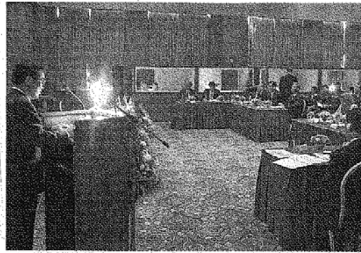
環境保全を生かしたまちづくりについて紹介する森博幸鹿児島市長（左） ＝ロシア・ウラジオストク

アジア太平洋地域の都市連携やネットワーク構築を目指し、行政関係者が意見交換などを行う「アジア太平洋都市サミット」の市長 会議が9月30日、ロシア・ウラジオストクであり、来年度の実務者会議が鹿児島市で開催されることが決まった。日本からは同市な