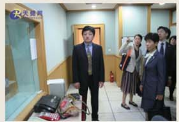
吉田市长参观电视台直播间。