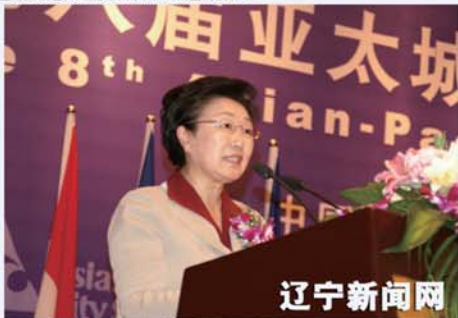
韩国前总理李明博

作者：宋太盛 来源：辽宁新闻网 发布时间：2008年09月29日 中新网辽宁9月29日电 (宋太盛)第八届亚太城市领导人会议于9月29日在中国美丽的海滨城市——大连举行。来自十三个国家、42个城市领导人及200余位代表齐聚大连，现场说法，交流经验，以解决伴随城市化发展而出现的城市问题。此次会议通过了韩国济州道、浦项两个城市的入会申请，从而使该组织的会员城市达到28个。 本次会议的主题是“亚太领军城市—环境、资源、文化及产业新思维”。韩国前总理李明博、中国人民对外友好协会副会长李建平应邀到会。世界创意产业之父、英国经济学家约翰·霍金斯，日本立命馆大学理事长长田丰臣分别做了主题为《文化驱动力、生态学创新》、《亚太地区的主题和高级人才的培养》的基调演讲。