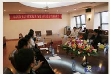
吉田市长认真听取同学们的自我介绍。