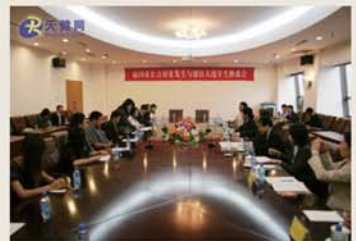
图为同留日学生座谈现场。