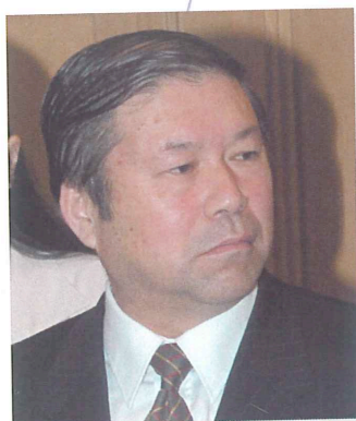
大連市 那良忠 副市長