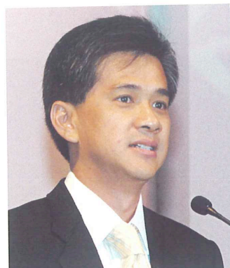
バンコク市 アピラック・コサヨディン 知事