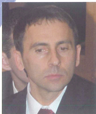
ウラジオストック市 ヴァクシェフ・ヴァイタリ 副市長