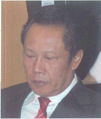
ジャカルタ特別市 ステイヨン 知事