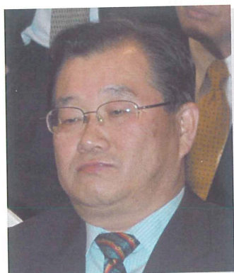
釜山市 金丘炫 副市長