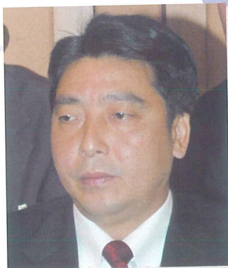
広州市 許瑞生 副市長