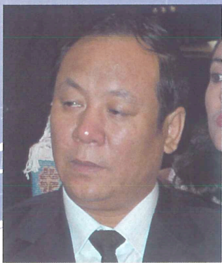
ウルムチ市 郭連山 副市長