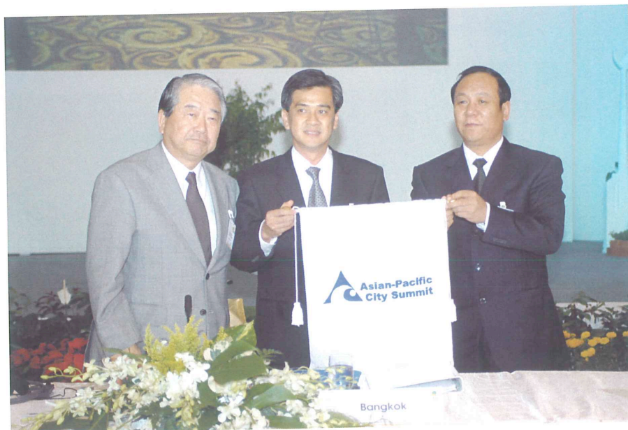
左／福岡市長 中央／バンコク知事 右／ウルムチ市副市長