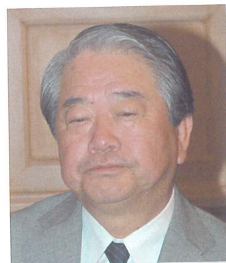
福岡市 山崎広太郎 市長