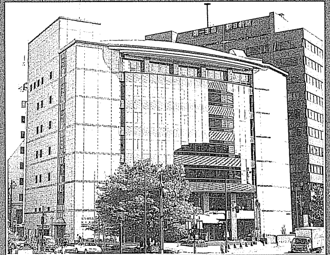
会場・熊本市国際交流会館