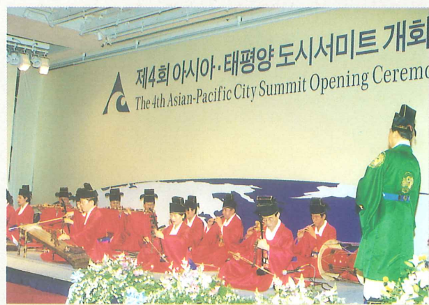
国楽演奏 (釜山市立管弦楽団)