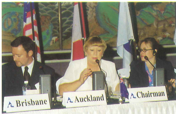
座長：クリスティン フレチャ・オ・クランド 市長