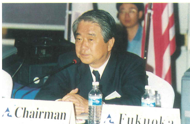
座長：山崎広太郎 福岡市長