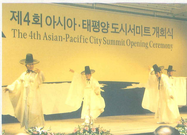
東萊鶴舞 (東萊民俗芸術保存協会)