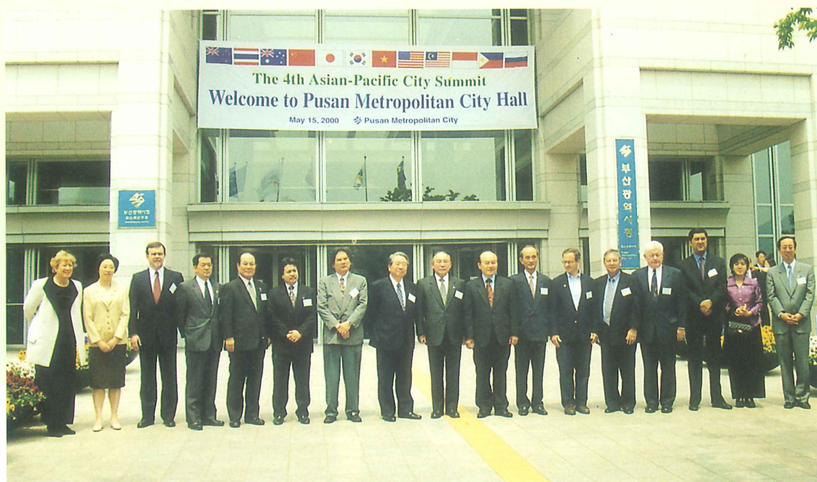
都市代表 市庁舎 訪問 記念撮影