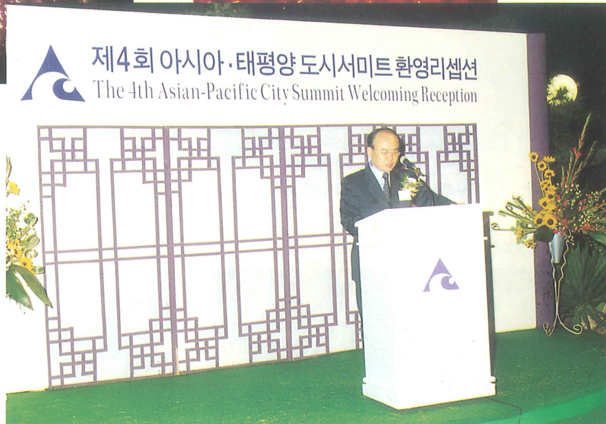
歓迎辞：安相英 釜山広域市長