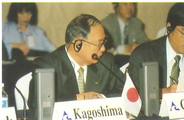
座長：赤崎義則 鹿児島 市長