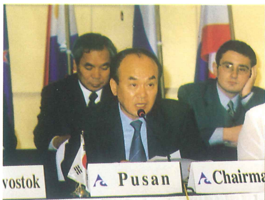
座長：安相英，釜山広域市長