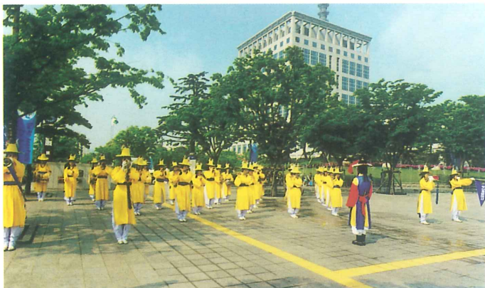
吹打隊の歓迎演奏