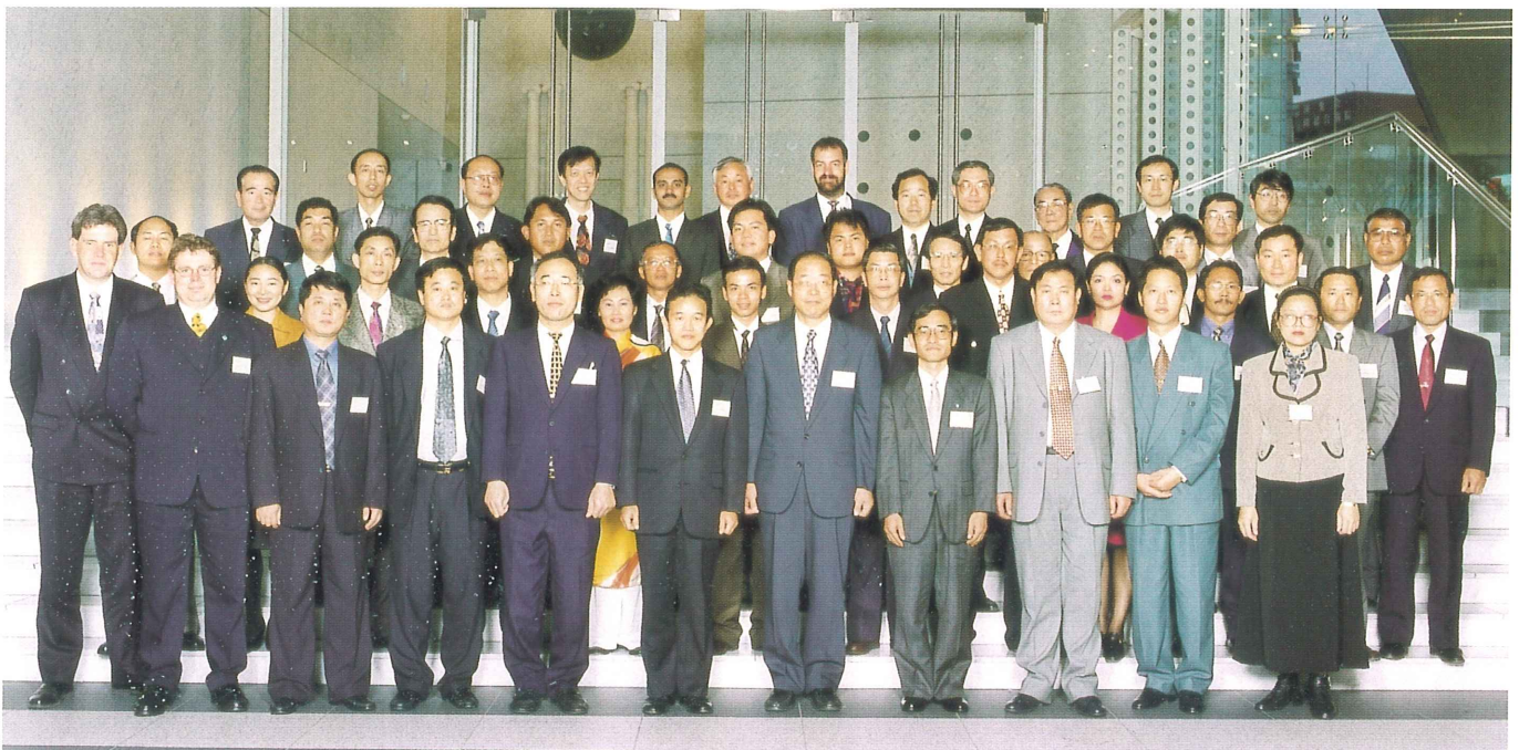
参加者全員による記念撮影