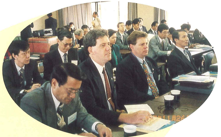
リフレッシュ農園研修室にて