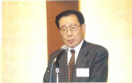
友池 一寛 福岡市助役(歓迎あいさつ)