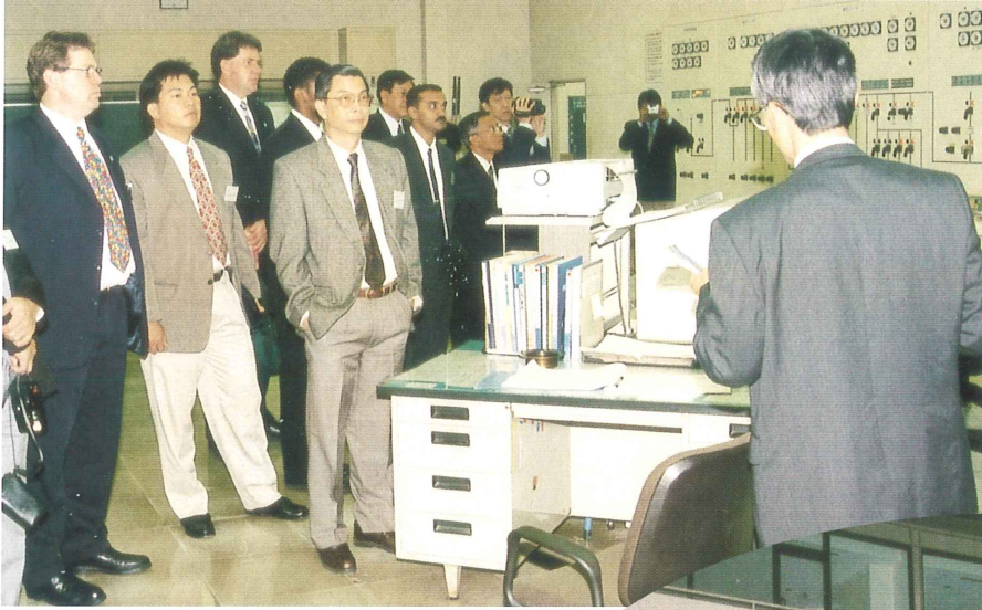
クリーンパーク・東部にて