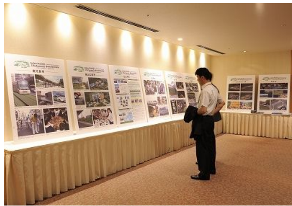
회장 밖에 설치된 각 도시의 사진전시