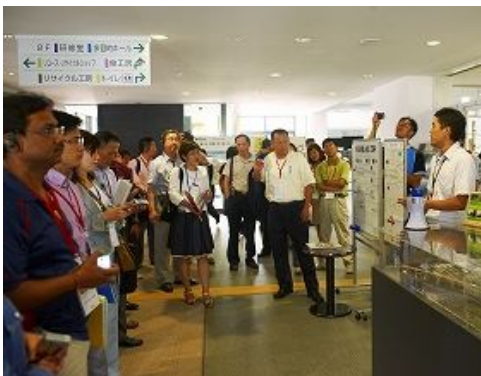
가고시마 환경미래관 시설설명