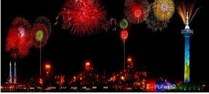
차기(2012년) 시장회의 개최도시 포항시