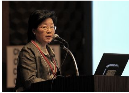
【방콕시(태국) 발표】 「방콕시의 지속가능한 발전 (세계 경제위기 속에서 새로운 도시 정책)」