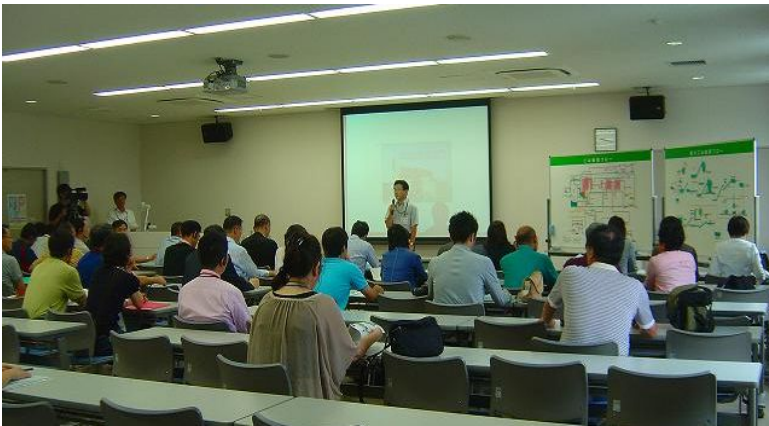
북부청소공장 시설 설명

회의 2 일째는 가고시마시의 환경관련 시설을 시찰하였습니다. 최신기술에 의해 공해방지 대책을 실시한 순환형 시설인 “북부청소공장”과 환경학습·리사이클 거점 시설 “가고시마 환경미래관”의 시찰, 빈 광통을 재이용한 작품 만들기를 추진하고 있는 가고시마대학· 시내 고등학생과의 교류회 등, 가고시마시의 환경관련 시책 등을 직접 체험하며 생각하는 아주 귀중한 기회였습니다. 참가도시의 대표자들은 앞으로의 각 도시의 시책에 참고가 될 것이라고 하였습니다.