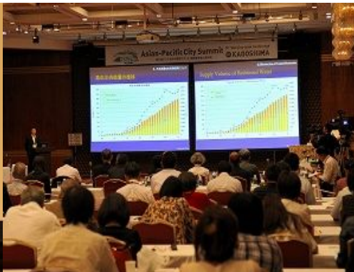
각 도시에서 추진 중인 선진적인 환경 대책에 대해 발표하였습니다.