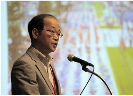
【가고시마시 발표】 「가고시마시의 쓰레기 행정에 대해」