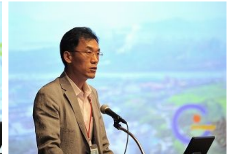
【광양시(한국) 발표】 「지역사회 협력을 통한 환경보전과 환경개선」