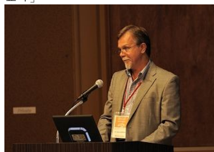
【블라디보스톡시(러시아) 발표】 「블라디보스톡시의 환경 시책」