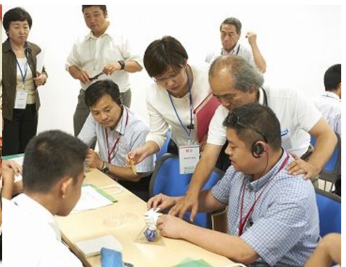
가고시마대학· 고등학생이 빈 광통으로 만든 오브제 설명을 받음