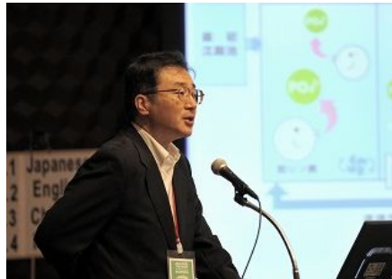
【후쿠오카시(일본) 발표】 「후쿠오카시의 하수도 자원 유효 이용과 국제공헌에 대해」