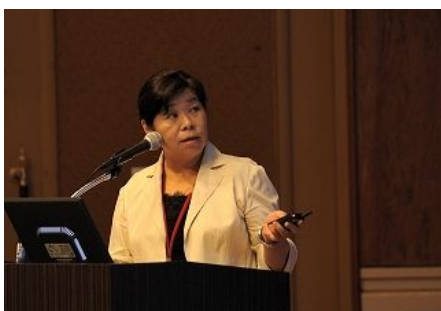
【구마모토시(일본) 발표】 「구마모토의 지속적인 지하수 보전」