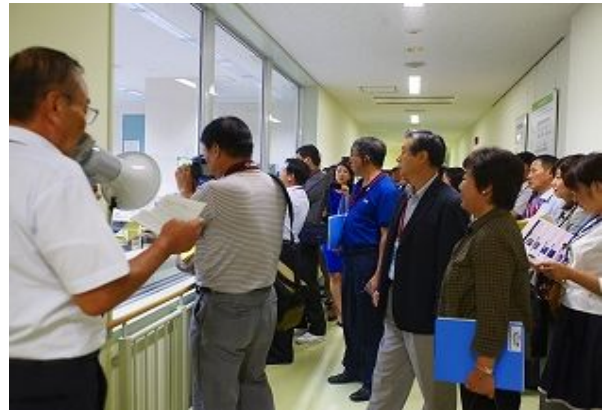
폐기물처리공정을 열심히 견학하는 참가자