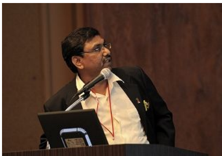
【아포시(말레이시아) 발표】 「하수도 관리의 환경위생적인 측면에서의 도전」