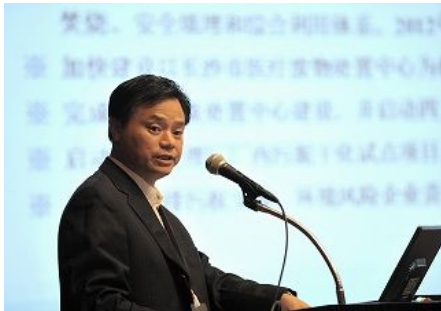
【창사시(중국) 발표】 「지속적인 발전을 향한 환경 시책 - 창사시의 환경보호와 생태 건설」