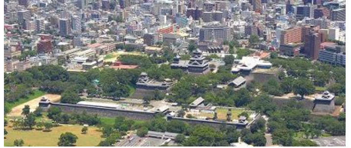
2013년 시장회의 개최도시 구마모토시

아시아 태평양 도시 서밋의 앞으로의 개최는, 2012년에는 한국 포항시에서 아시아 태평양 도시 서밋(시장회의)을, 2013년에는 일본 구마모토시에서 아시아 태평양 도시 서밋(시장회의)을 예정하고 있습니다. 회원도시의 여러분의 많은 참가를 부탁드립니다.