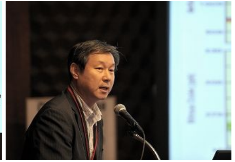
【부산광역시(한국) 발표】 「기후변화 대응 추진정책」