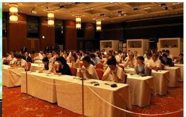
환경에 관심이 있는 시민방청객 120 명도 열심히 발표를 들었습니다.