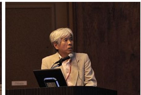
【기타큐슈시(일본) 발표】 「지속가능한 사회를 향한 환경모델 도시 · 기타큐슈시의 시책」