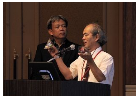
【가고시마대학 · 데콕시(인도네시아) 공동 발표】 「연대를 통한 '지속가능한 에너지 교육」