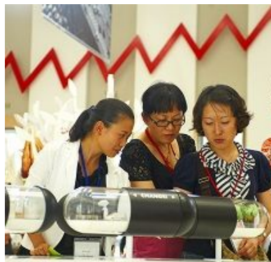
아이디어 전시물을 보고있는 참가자 4