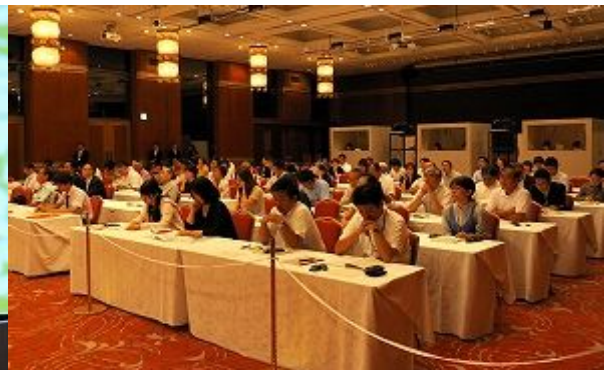
120位关心环境问题的热心市民旁听者们听得聚精会神