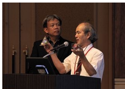
【鹿儿岛大学·印尼戴伯克市共同演讲】 “携手发展‘可持续能源教育’”