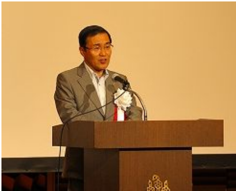
鹿儿岛市市长的开会致辞