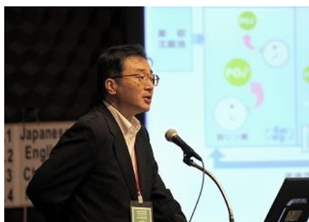
【日本福冈市】 “福冈市下水道资源的有效利用与国际贡献”