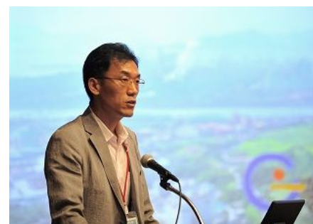
【韩国光阳市】 “地区社会合作推进的环境保护和改善”