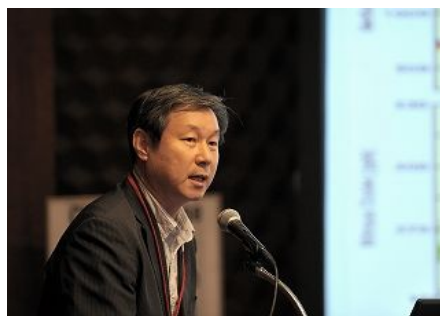
【韩国釜山广域市】 “应对气候变化的推进政策”