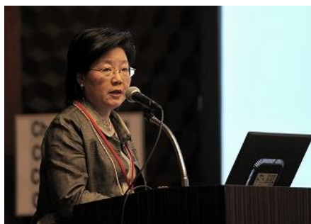
【泰国曼谷市】 “曼谷市的可持续发展 (全球经济危机下的城市新政策)”