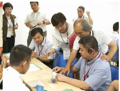
鹿儿岛大学学生以及市内高中生们为参观者们解说用空罐子做成的物体