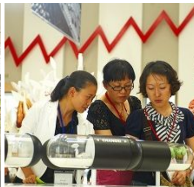
海外参观者们目不转睛地欣赏技术精湛的展品