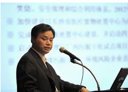
【中国长沙市】 “追求可持续发展的环境 —长沙市环境保护与生态建设”