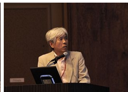
【日本北九州市】 “追求可持续发展的环境模范城市— 北九州市的政策”