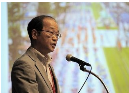
【鹿儿岛市演讲】 “鹿儿岛市垃圾政策”