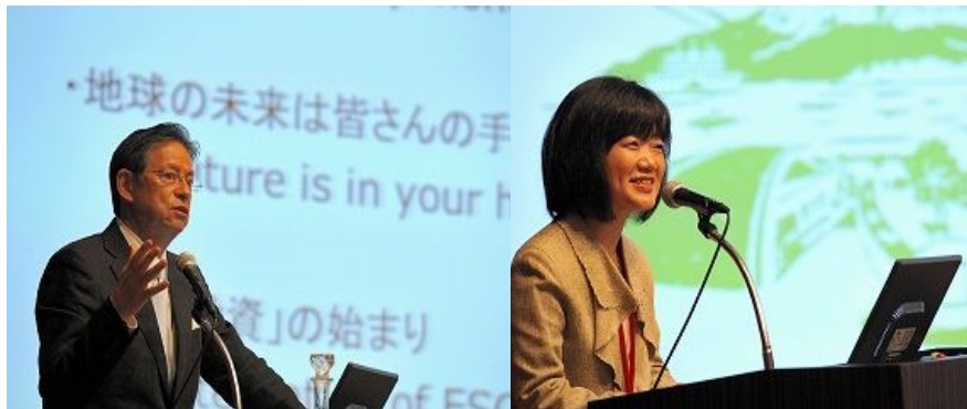
主题演讲“21世纪城市建设” 联合国环境规划署金融倡导部特别顾问 末吉竹二郎