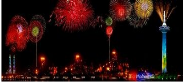
下届（2012年）市长会议举办城市浦项市