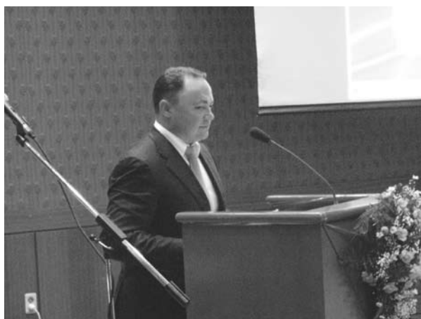
ウラジオストク市長の開会挨拶