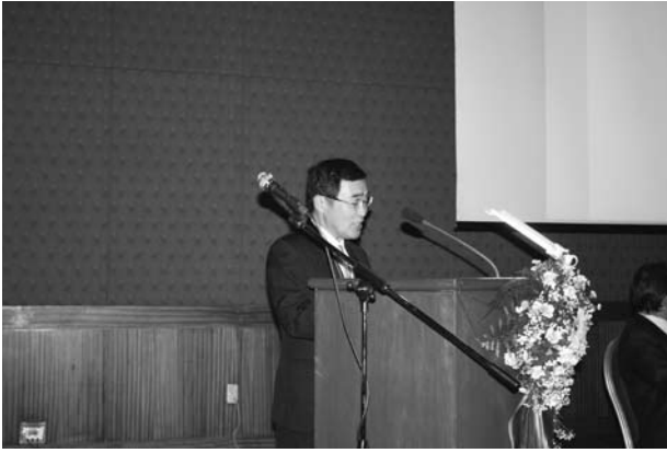
森 博幸 鹿児島市長 「環境の保全と持続可能なまちづくり」