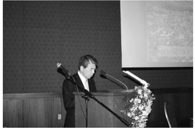
戸敷 正 宮崎市長 「新しい都市づくり～宮崎市の取組み～」