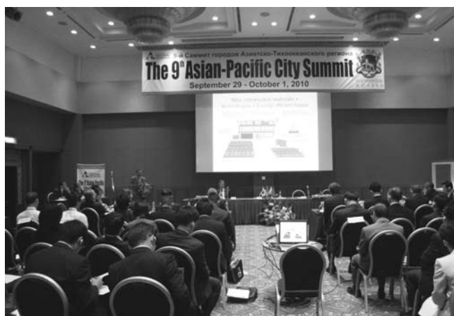
基調講演「現代における持続可能な都市の発展」 極東国立大学 タギル・クジヤトフ氏