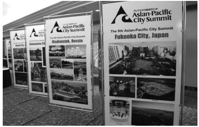
各都市の写真展示