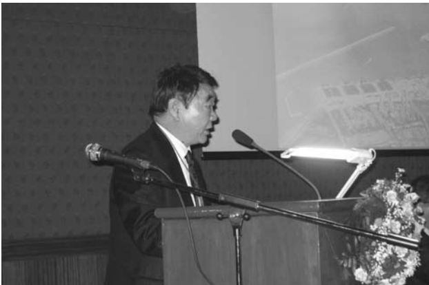
尹 情 鏞 浦項市副市長 「都市プロモーションによる経済活性化」