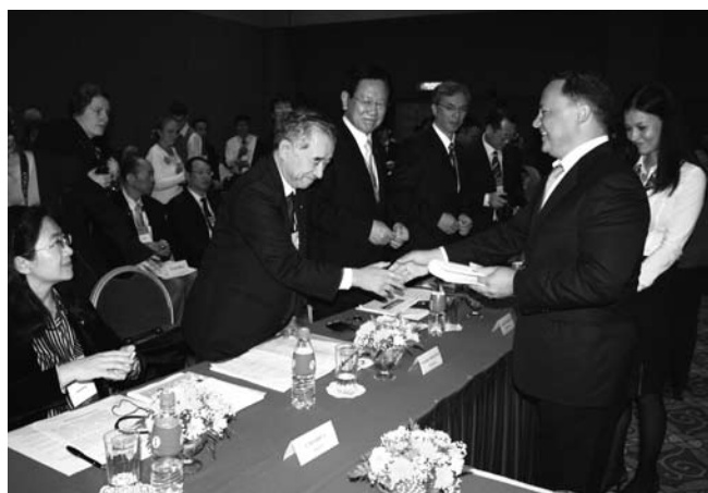
参加都市代表者と挨拶するウラジオストク市長